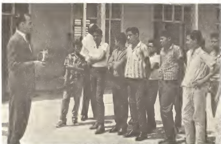
Den e wega di football interscolar na juli 1967 e team di St. Jozefschool na Santa Cruz a sali campeon. Deputado di Enseñanza Señor Betico Croes a duna e team un cordial felicitation y a entregá nan e copa di campeon.